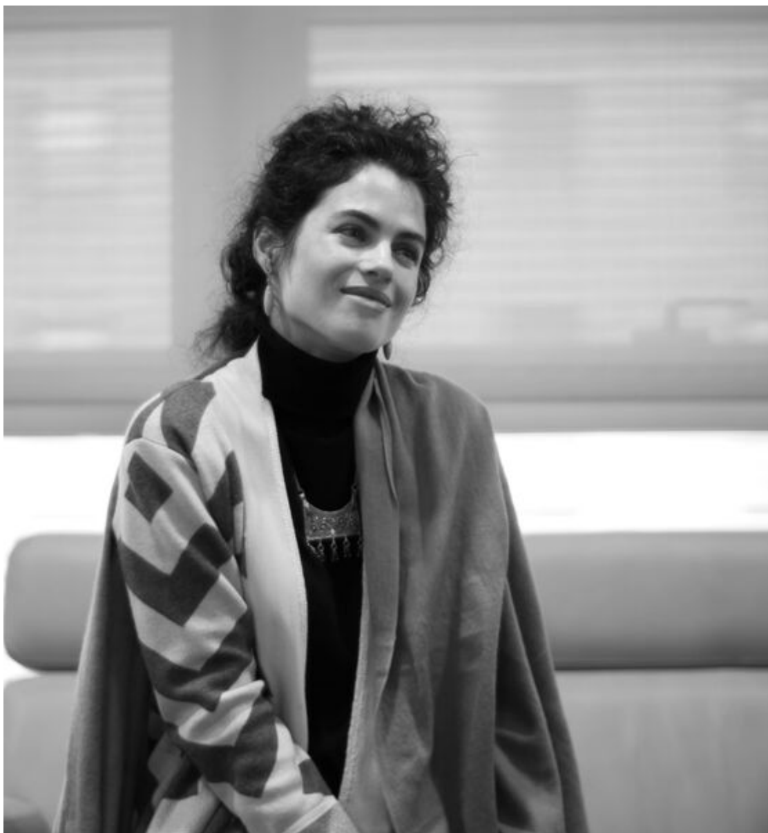
Neri Oxman

Née le 6 février 1976 à Haïfa, est une architecte et designer israélo-américaine, connue pour son travail en architecture bioclimatique et en morphogénèse numérique. Depuis 2010, elle enseigne au Media Lab du Massachusetts Institute of Technology (MIT), où elle devient aussi fondatrice du groupe de recherche Mediated Matter .