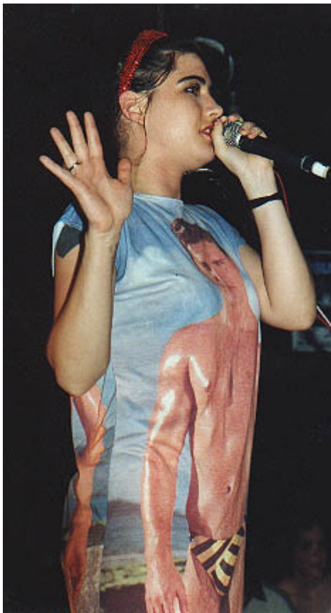
Kathleen Hanna avec Bikini Kill - 17 January, 1996 - Annandale Hotel, Sydney Australia

Née en 1968, Kathleen Hanna propose à Tobi Vail, chroniqueuse d'un fanzine féministe, de former un groupe de musique. Elles s'associent avec deux autres musiciennes, Billy Karren et Kathi Wilcox, et nomment leur groupe Bikini Kill . Lors des concerts du groupe, une nouvelle règle s'impose : celle du « Girls to the front », qui invite les filles à venir en première ligne à la place des garçons.