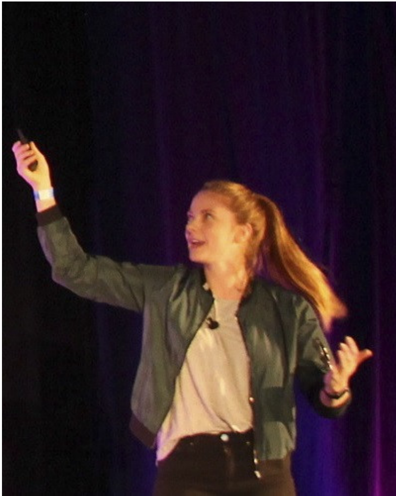
Simone Giertz au Palais des Arts building à San Francisco.

Inventrice et roboticienne autodidacte suédoise, elle crée des robots "inutiles" pour tenter de résoudre des problèmes du quotidien. Elle est vidéaste et animatrice et partage ses expérimentations avec beaucoup d'humour sur sa chaîne Youtube, depuis 2013. Elle a également présenté une conférence TedX en 2018 " Pourquoi vous devriez fabriquer des choses inutiles ".