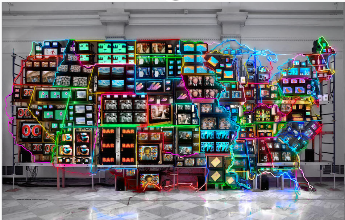
Nam June Paik, Electronic Super Highway , 1974