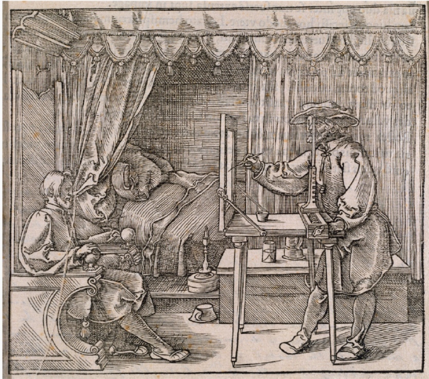
Albrecht Dürer, Dessinateur traçant un portrait , 1532. Le corps s'unit à la machine.