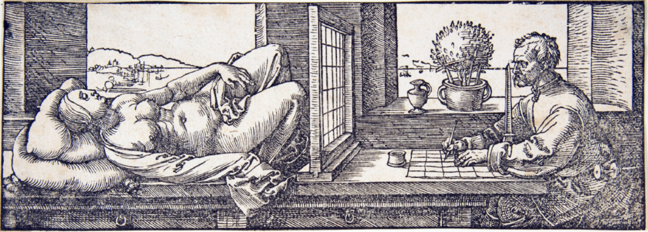
Albrecht Dürer, vers 1525, le plaisir de dessiner puissance carrée.