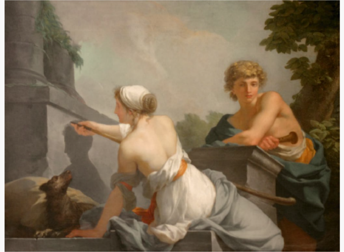
Anonyme, la Grotte de Platon , 15xx