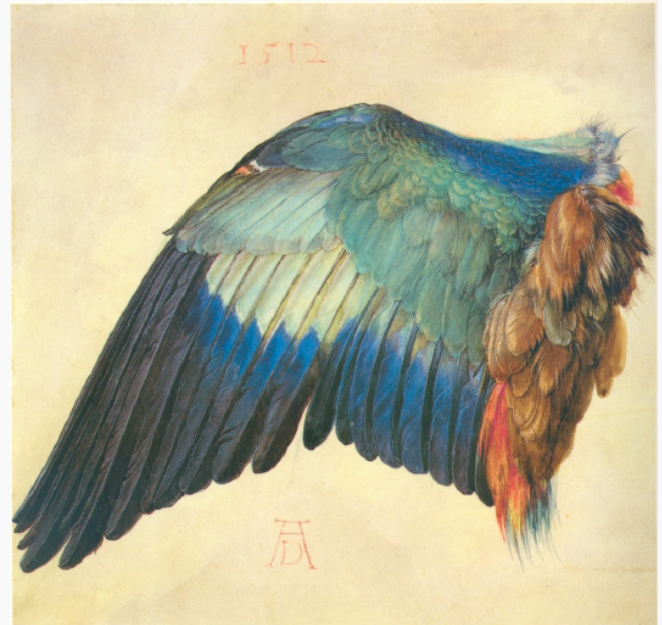
Albrecht Dürer, Aile de Rollier bleu , 1512