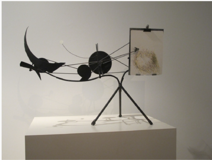
Jean Tinguely, Méta-matic n°6 , 1959