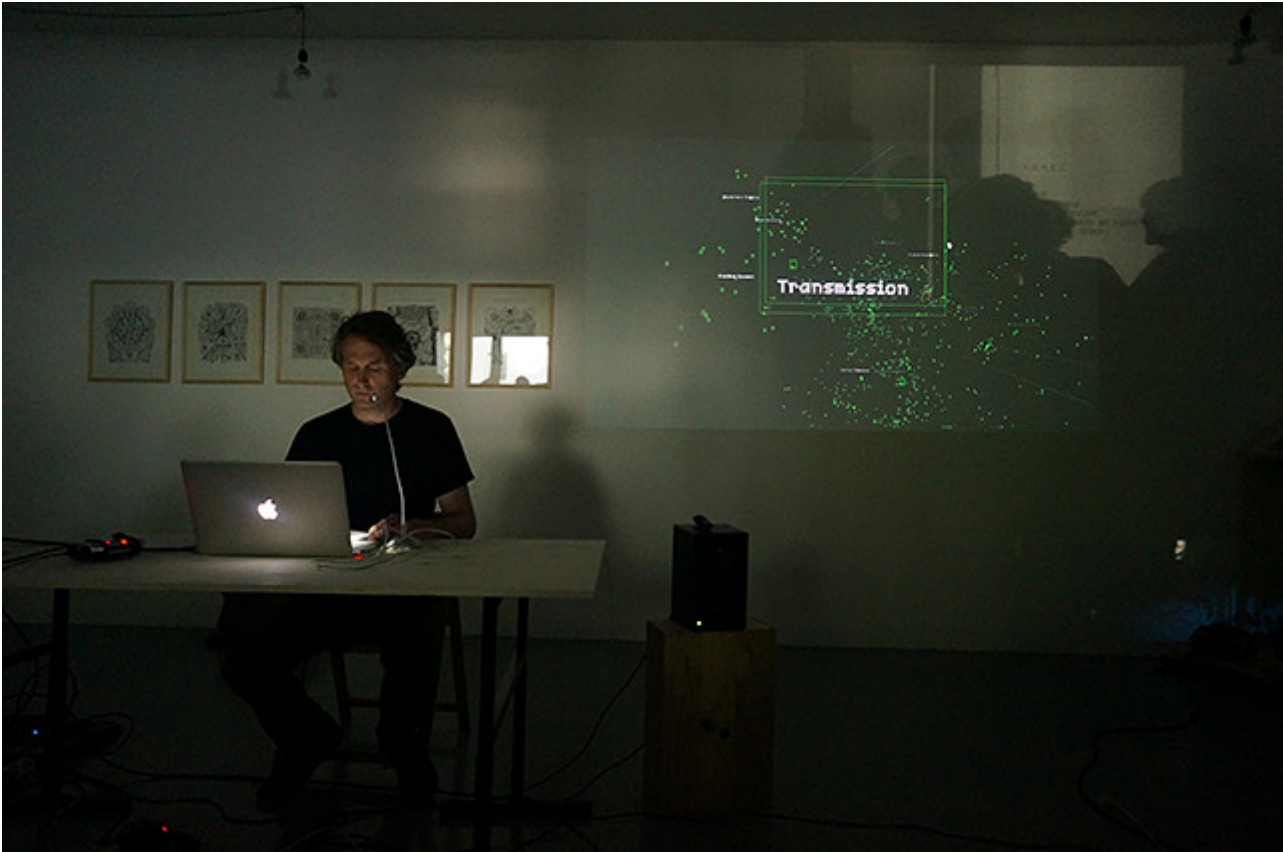
Media Médioms, Paris, 2014