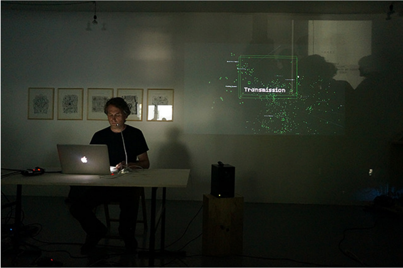
Media Médiums, Paris, 2014