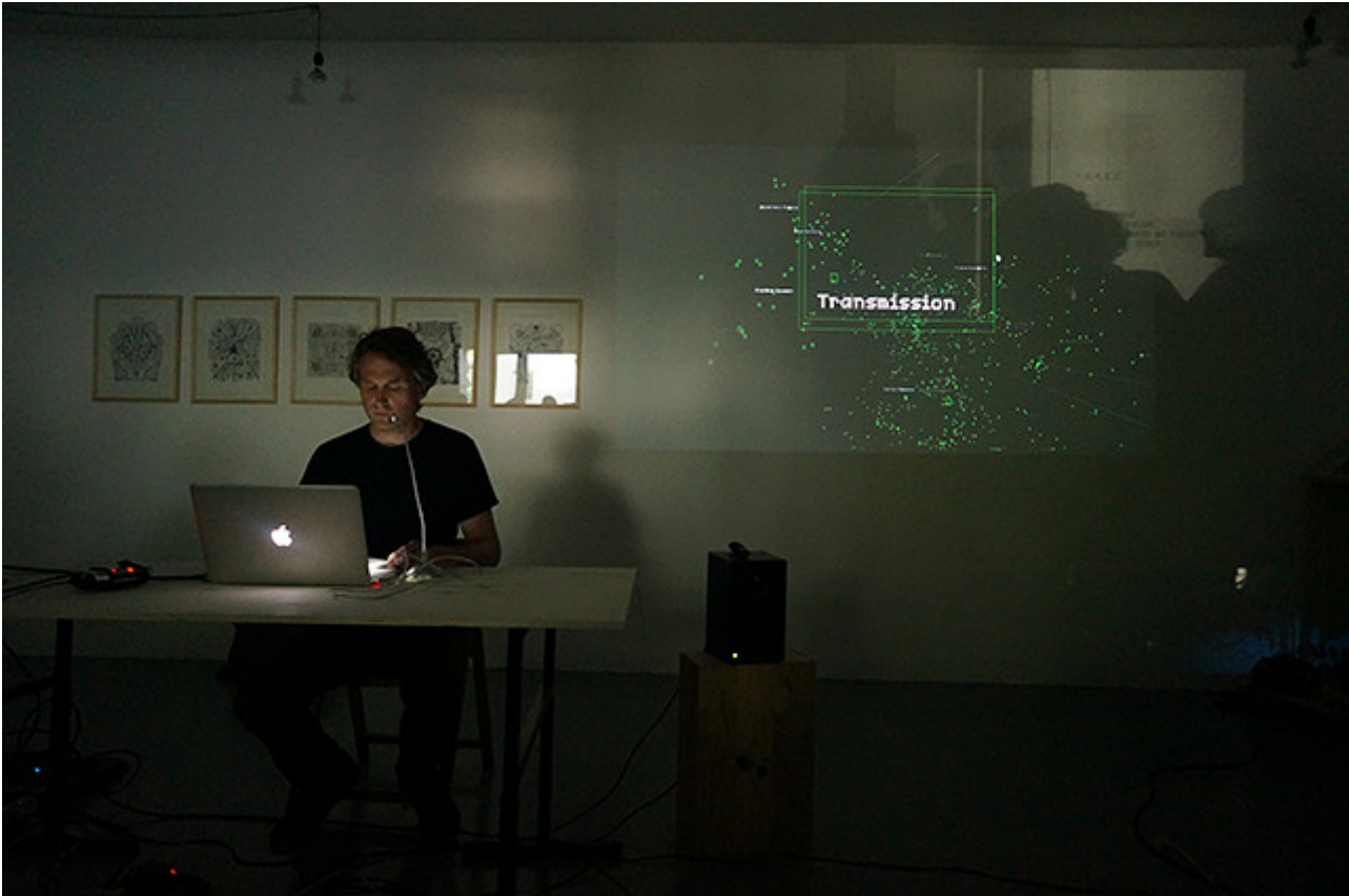
Media Médiums, Paris, 2014